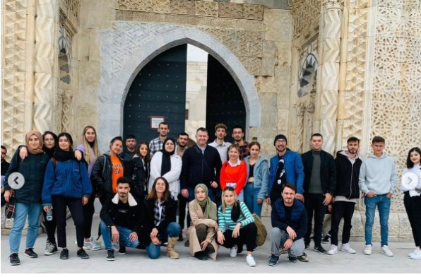
Sultanhanı Kervansarayı Gezisi