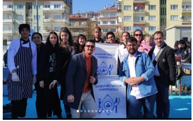
Niğde Üniversitesi Yemek Yarışması

C.6.7. Öğrencilerin kullanımına yönelik tesis ve altyapılar (yemekhane, yurt, teknoloji donanımlı çalışma alanları vs.) mevcut mudur? (Sunulan hizmet ve destekleri; erişilebilirlik, geri bildirim, şikâyetlere duyarlılık ve ihtiyaçlara uygunluk açılarından değerlendiriniz.)